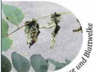
Blattspindel-Nekrose und Blattwelke