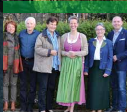
Kulturverein Seite 20