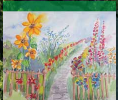
Vorgartenwettbewerb Seite 21