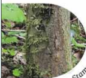
Rindennekrose am Stammfuß