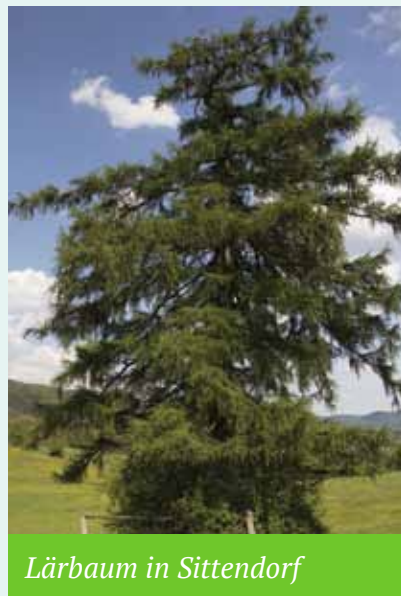
Lärbaum in Sittendorf

für die Bäume zum Ortsbild, zur Lebensqualität und zum Mikroklima dazugehören. Ich würde mir wünschen, wenn ich und die betroffenen Anrainer über bevorstehende Fällungen vorab informiert würden. Bei diesen besonderen Bäumen sollte vor einer Schlägerung ein Baumexperte herangezogen werden, der beurteilen kann, ob und wie ein Baum vielleicht doch erhalten werden kann.