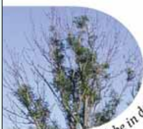
abgestorbene Triebe in der Baumkrone