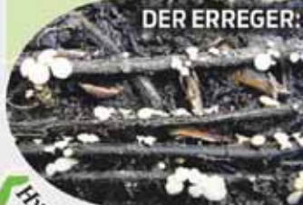
DER ERREGER: Hymenoscyphus fraxineus , (Eschen-Stengelbecherchen), ein Schlauchpilz aus Ostasien. Er bildet auf den Blattspindeln abgeworfener Eschenblätter seine 2 bis 7 mm kleinen, weißen Fruchtkörper.

KURIER Grafik: Eber, Bilder: Thomas Kirisits IFFF-BOKU (4), Coldimages/iStockphoto